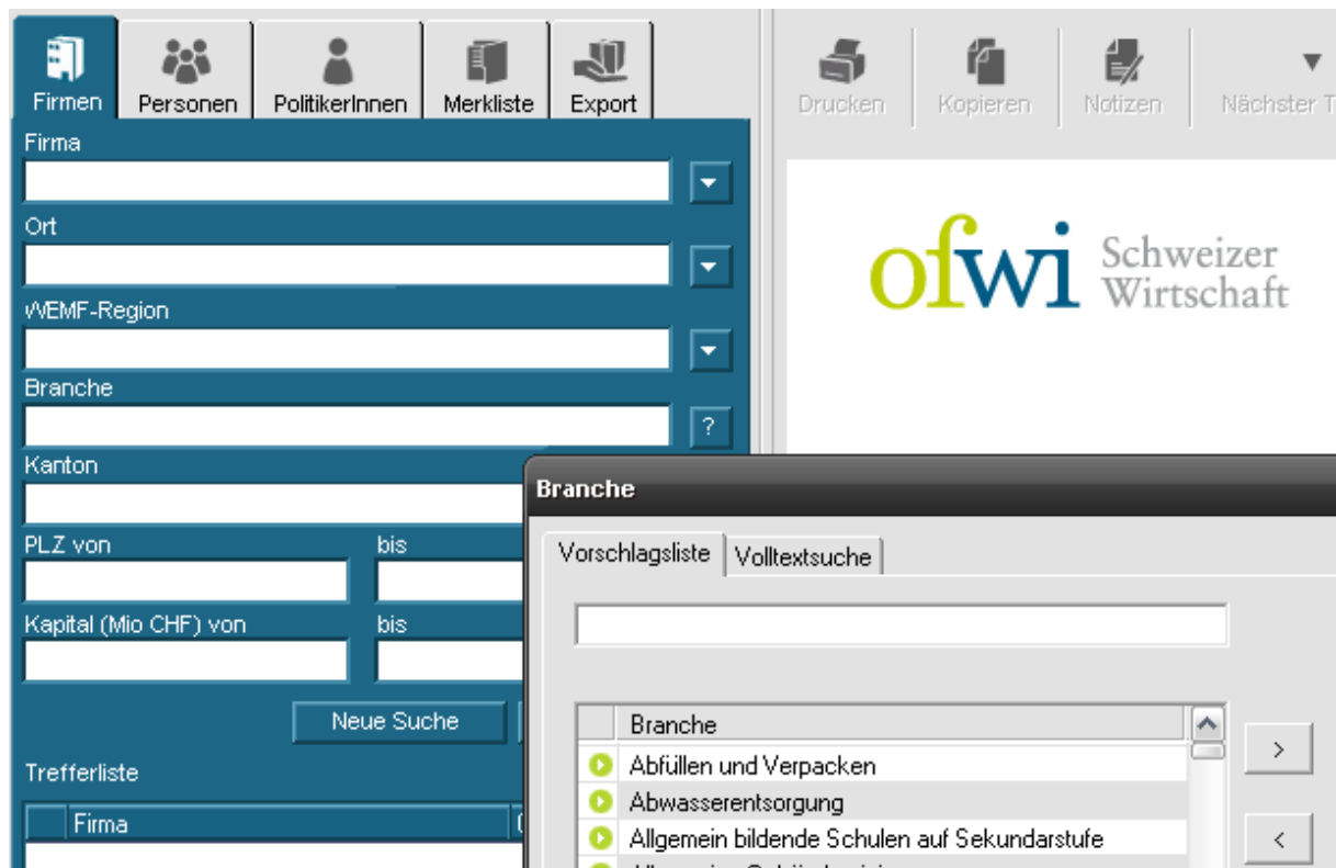
Abbildung 1: Aufruf der Vorschlagsliste

1. Klicken Sie auf das « ? » neben dem Eingabefeld zur Branche.